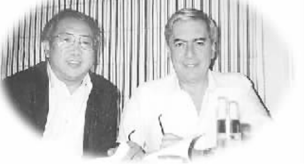
本文作者与巴尔加斯·略萨 1995年摄于西班牙

1994年7月12日,中央编译局原常务副局长尹承东约我一道去北京王府饭店见巴尔加斯·略萨。我的第一印象就是双方一见如故。我记得他说全家六口是从几个不同的地方来中国的,因为两个儿子、儿媳、女儿分别在不同的国家工作或学习。大家相约来北京是因为都对中国的变化感兴趣。我在翻译《水中鱼》,有些疑难请他帮忙,他当时正准备去长城,但立刻让他