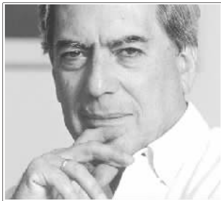
马里奥·巴尔加斯·略萨

2010年诺贝尔文学奖得主,拥有秘鲁与西班牙双重国籍的作家及诗人,有“结构写实主义大师”的称号,酷爱足球。曾短期从政,年轻时曾加入秘鲁共产党和支持古巴革命。后组建新党,立场“右倾”,1990年在总统竞选中败给藤森。他读过中国作家鲁迅、茅盾、巴金等的作品,也曾于1994年7月6日借家眷来华访问。